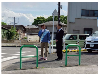
八雲祭（羽村駅西口）にて