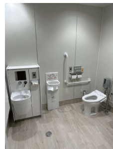
改修後の誰でもトイレ